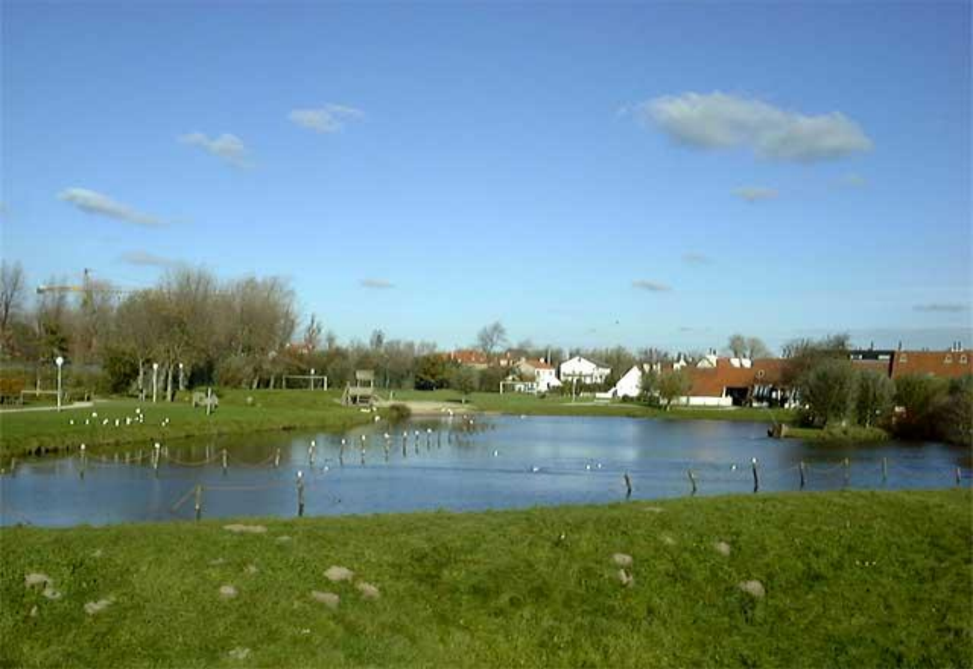
Links van je ligt het vakantiedomein "Ysermonde", een familiaal vakantieoord in hoevestijl met heel wat sportaccommodaties, een oase van rust zelfs tijdens de drukke vakantiemaanden.