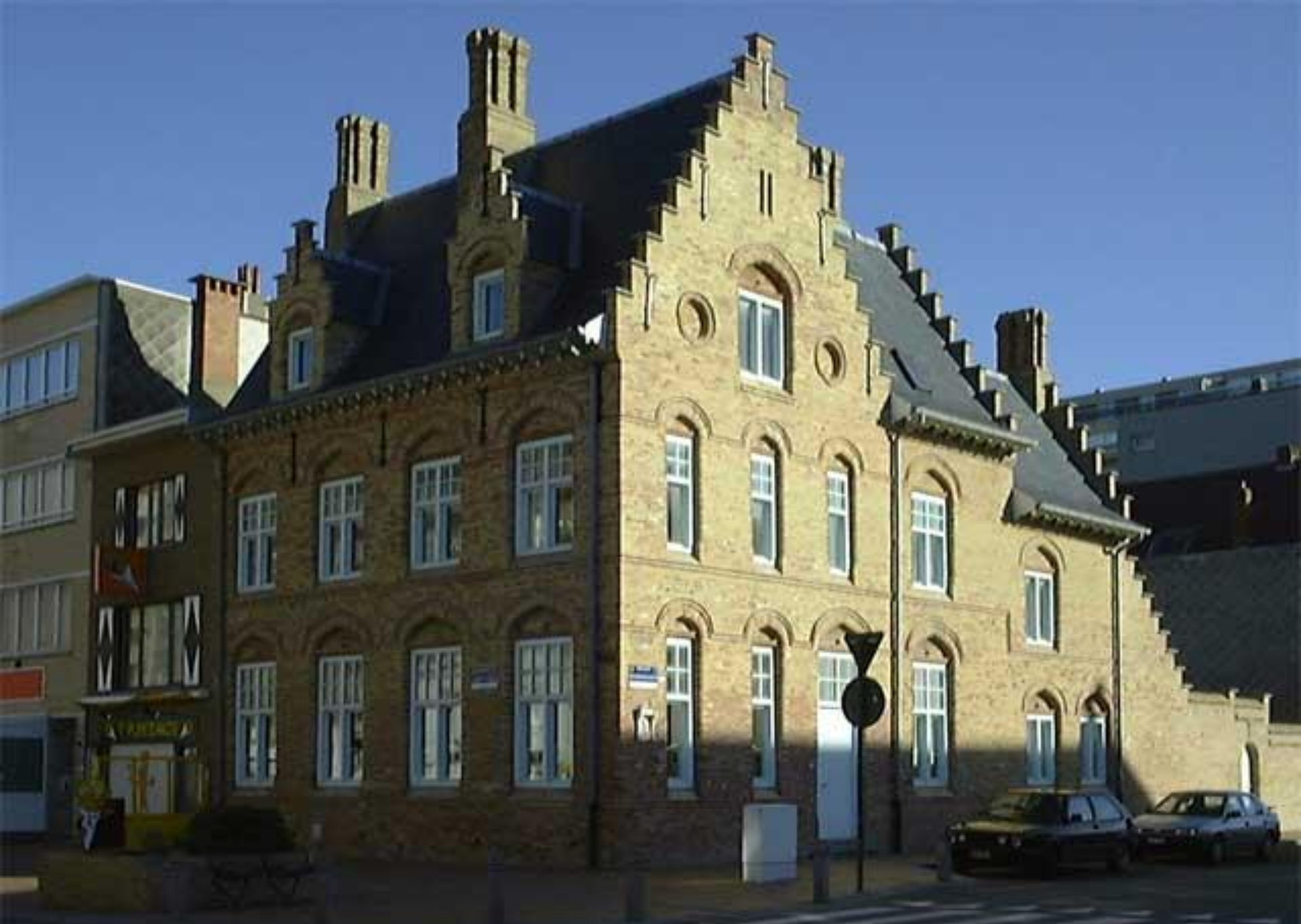
Pastorie in Vlaamse Renaissancestil uit 1922