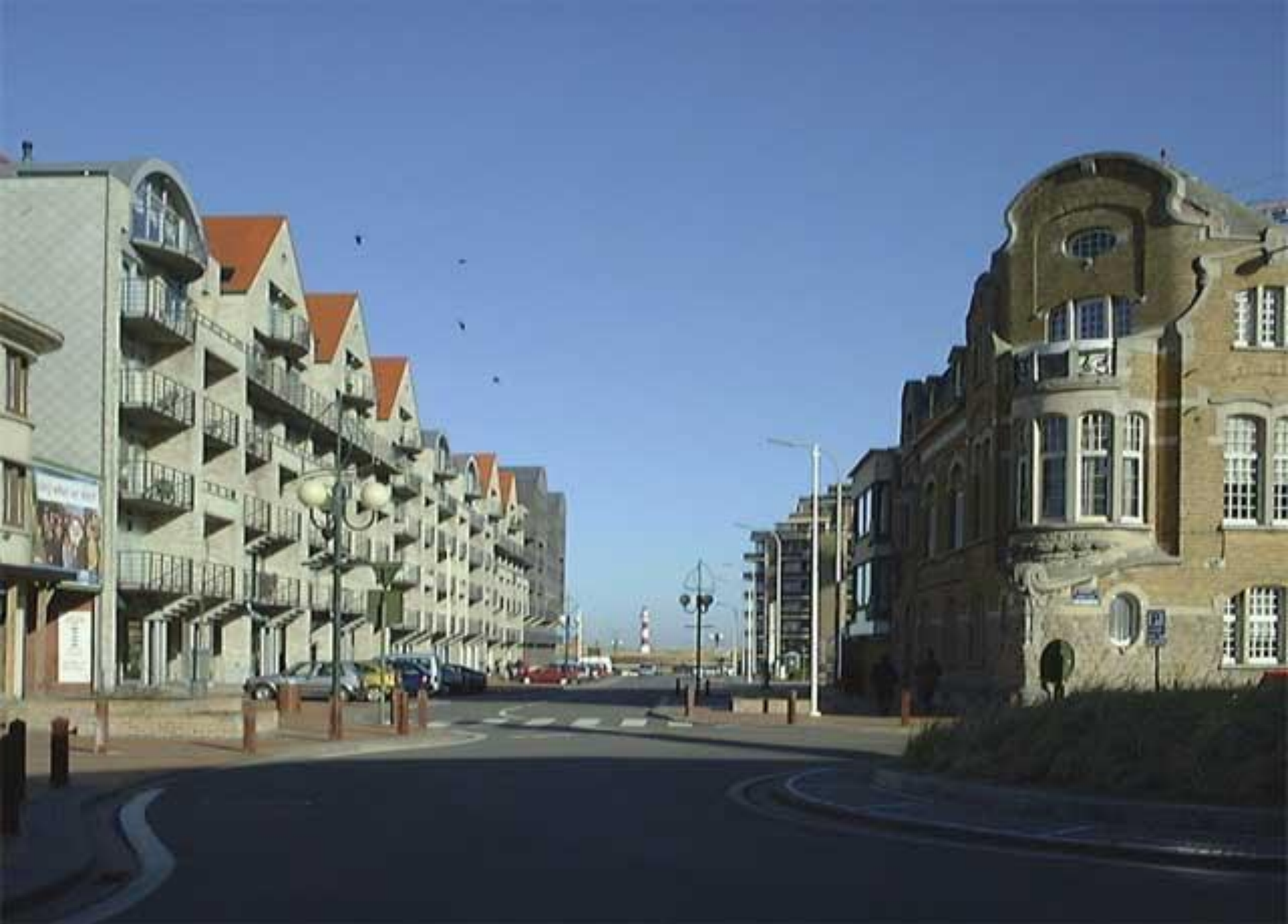
Een blik in de straat voor ons geeft een mooi zicht op de vuurtoren.