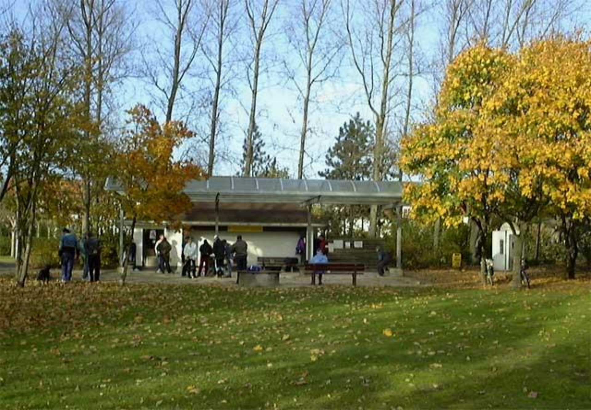
Een kleine helling naar links op het einde van de Mosweg brengt je via de George Eeckhoudlaan (Vlaams Letterkundige 1887-1951) naar het Guido Gezelleplein (Vlaams Dichter 1830 -1899) en je draait links af.