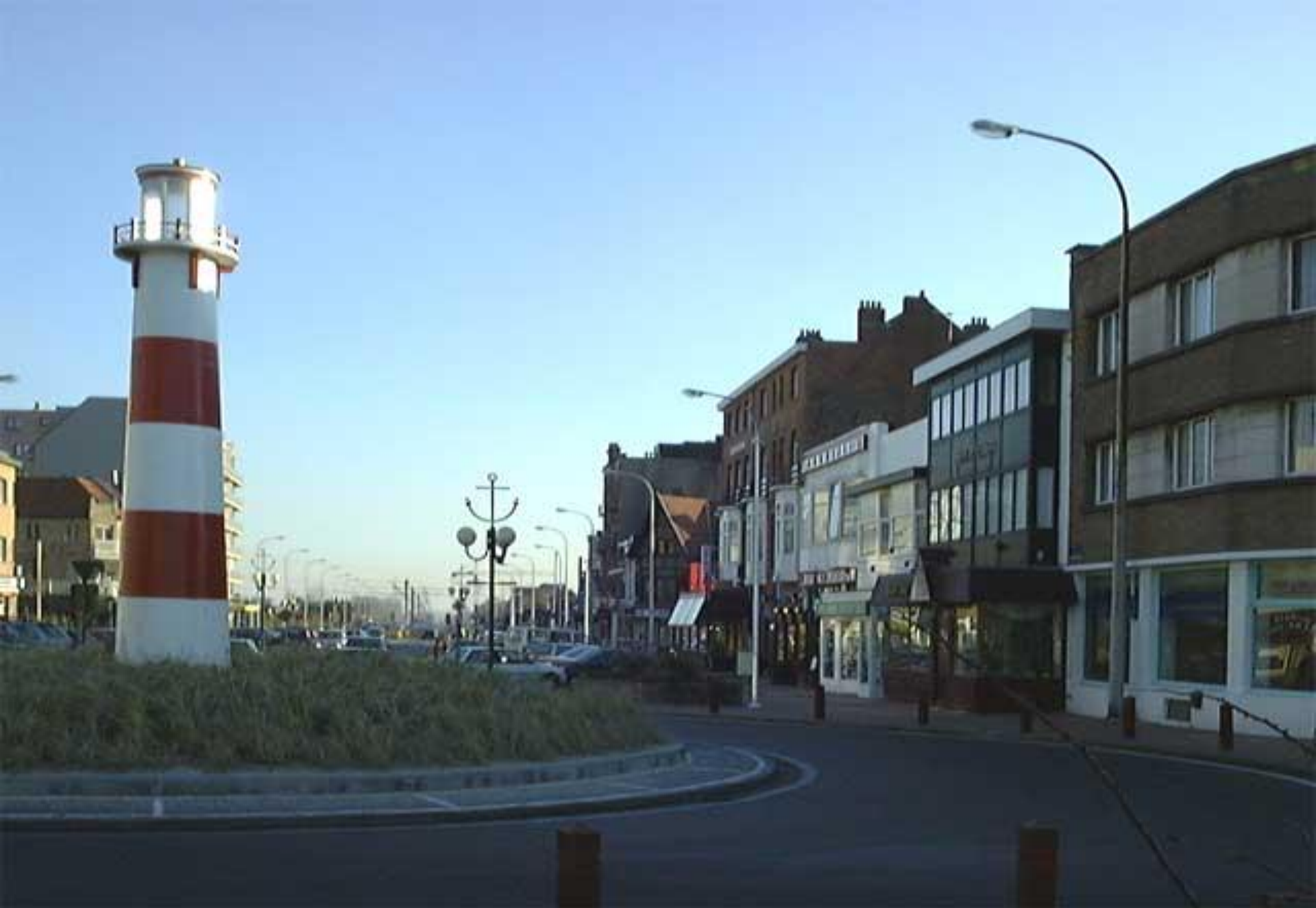
Het zebrapad aan de rotonde steek je over en komt zo aan de rechterkant van de Albert I- laan richting Nieuwpoort- stad.