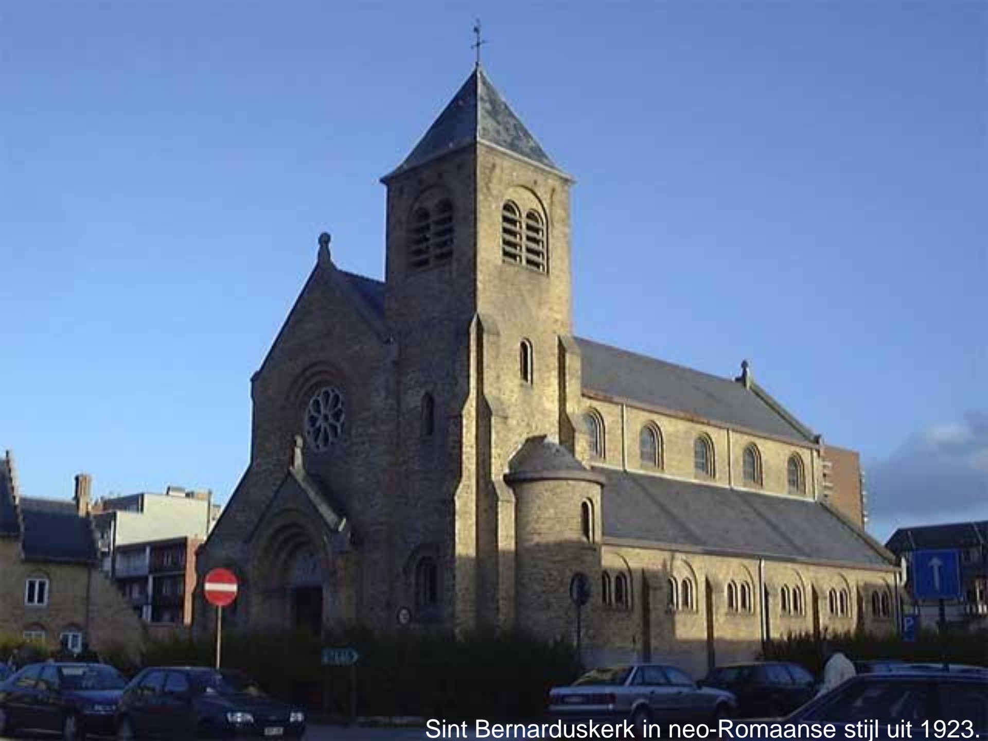
Sint Bernarduskerk in neo-Romaanse stijl uit 1923.