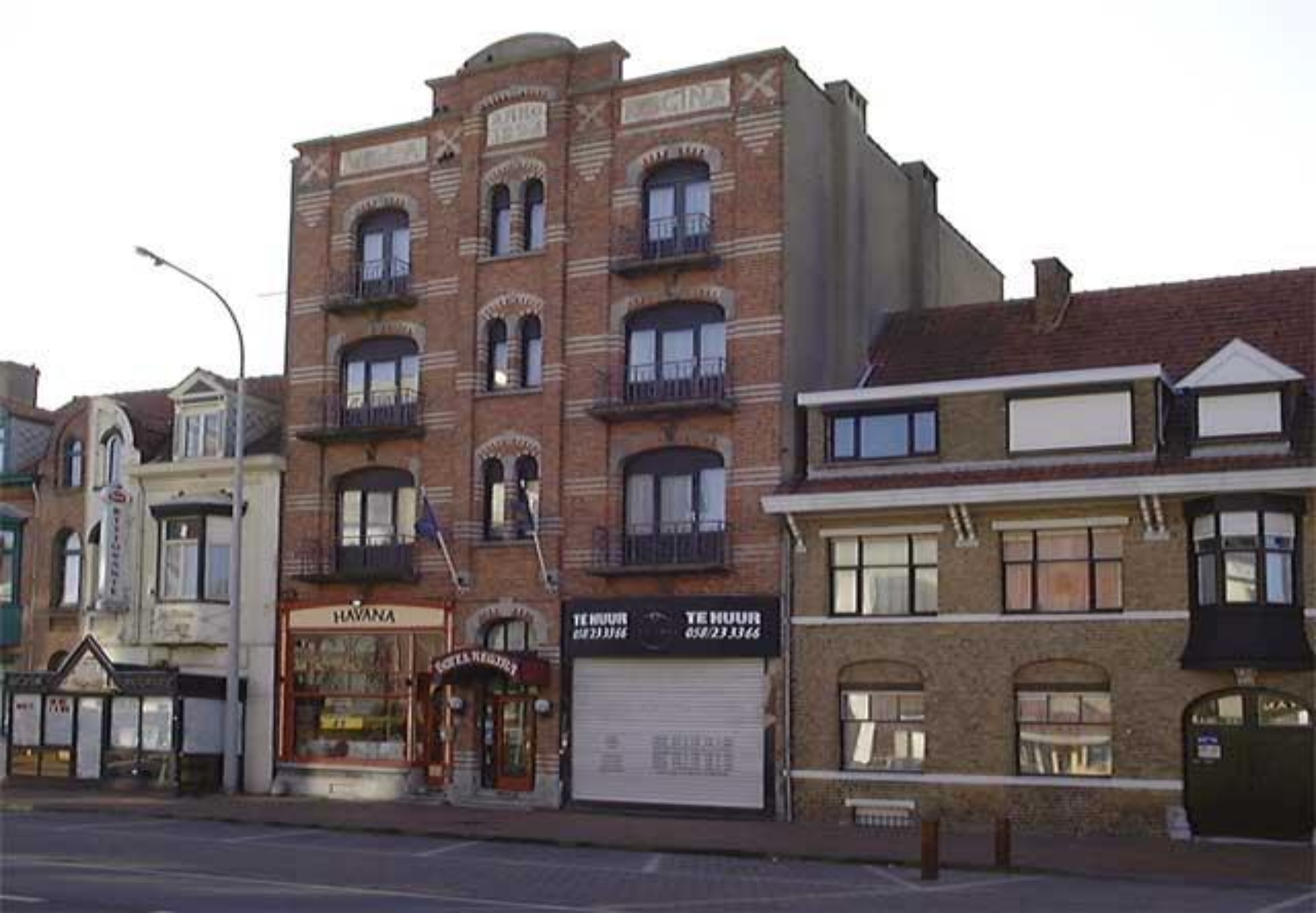
Even verder aan onze rechter zijde zie je een gebouw daterend van 1924 met de naam " Villa Regina ". Een kubistisch gebouw met vier bouwlagen dat relatief zeer hoog was voor zijn tijd.