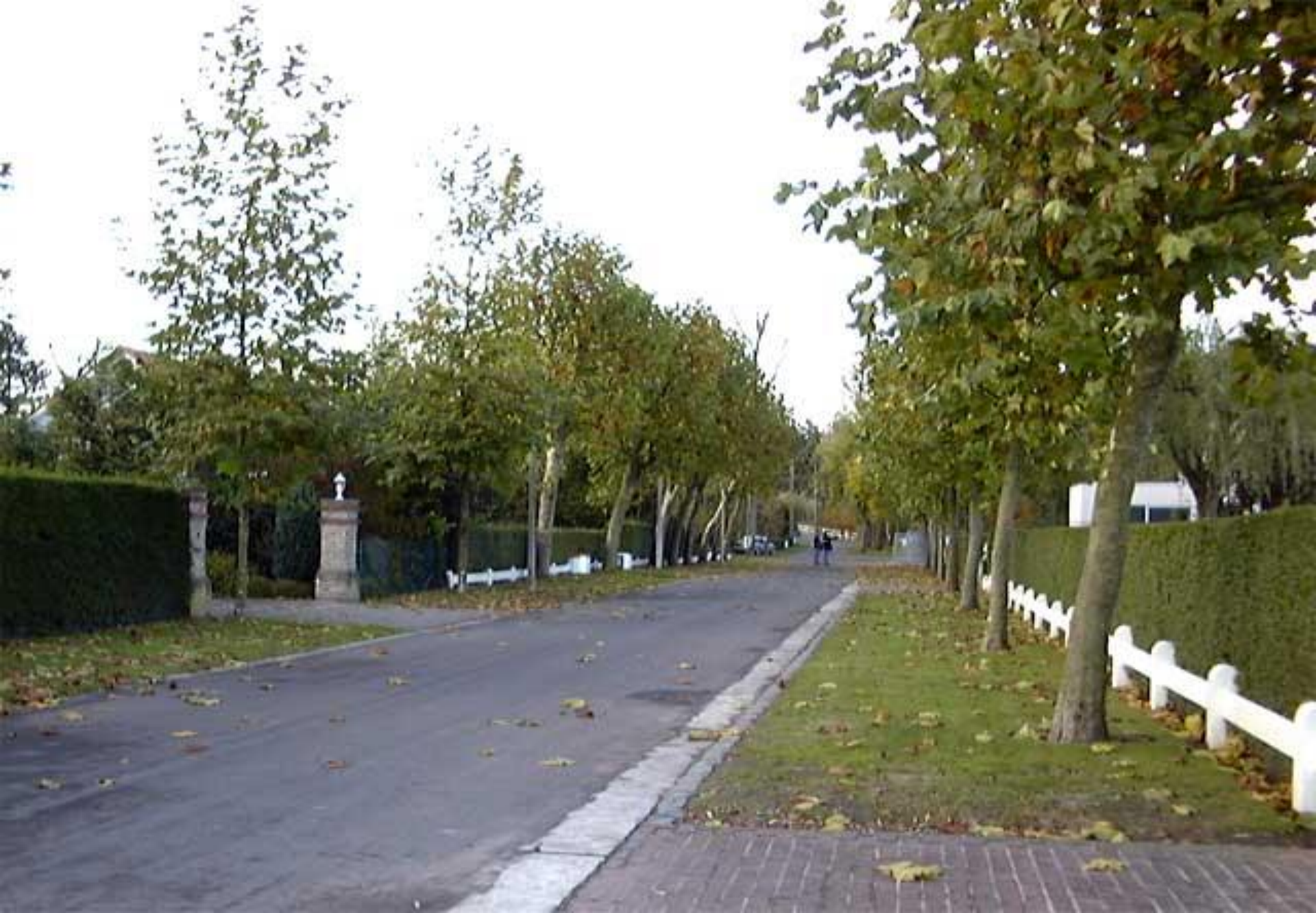
Even verder wandel je rechts de met platanen omzoomde Emile Verhaerenlaan (een Fransschrijvende Vlaamse letterkundige 1855 - 1916) in.