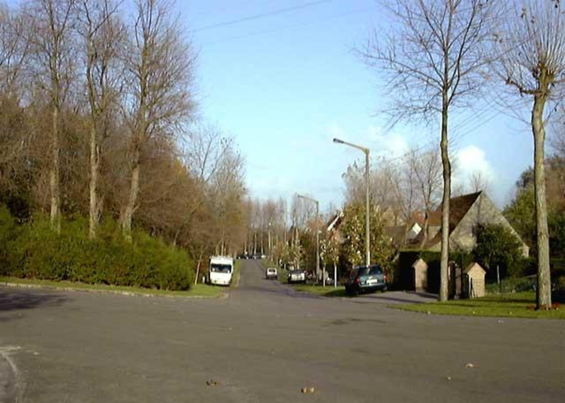
G. Rodenbachlaan - E. Verhaerenlaan - F. Courtenslaan