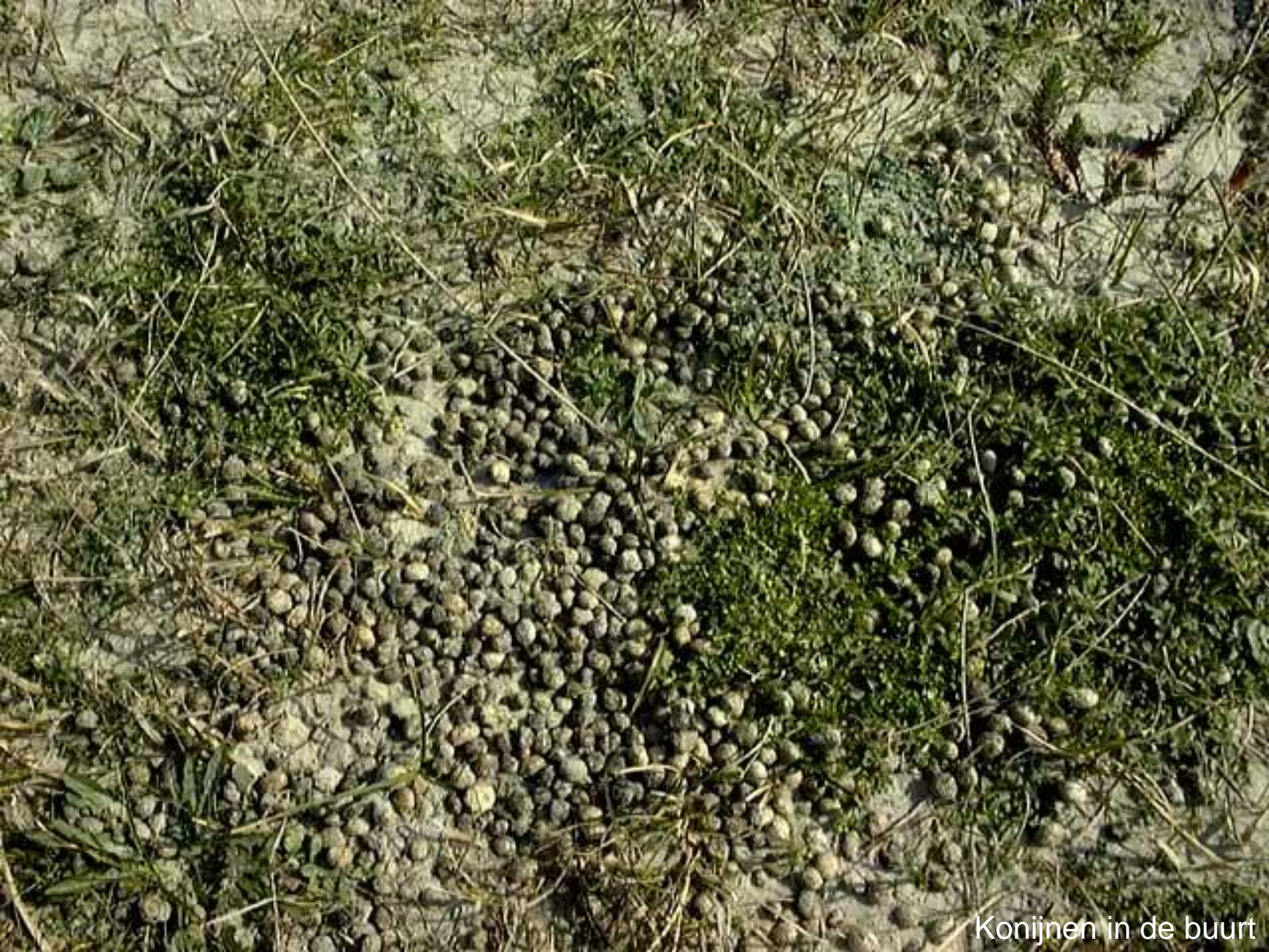
Konijnen in de buurt